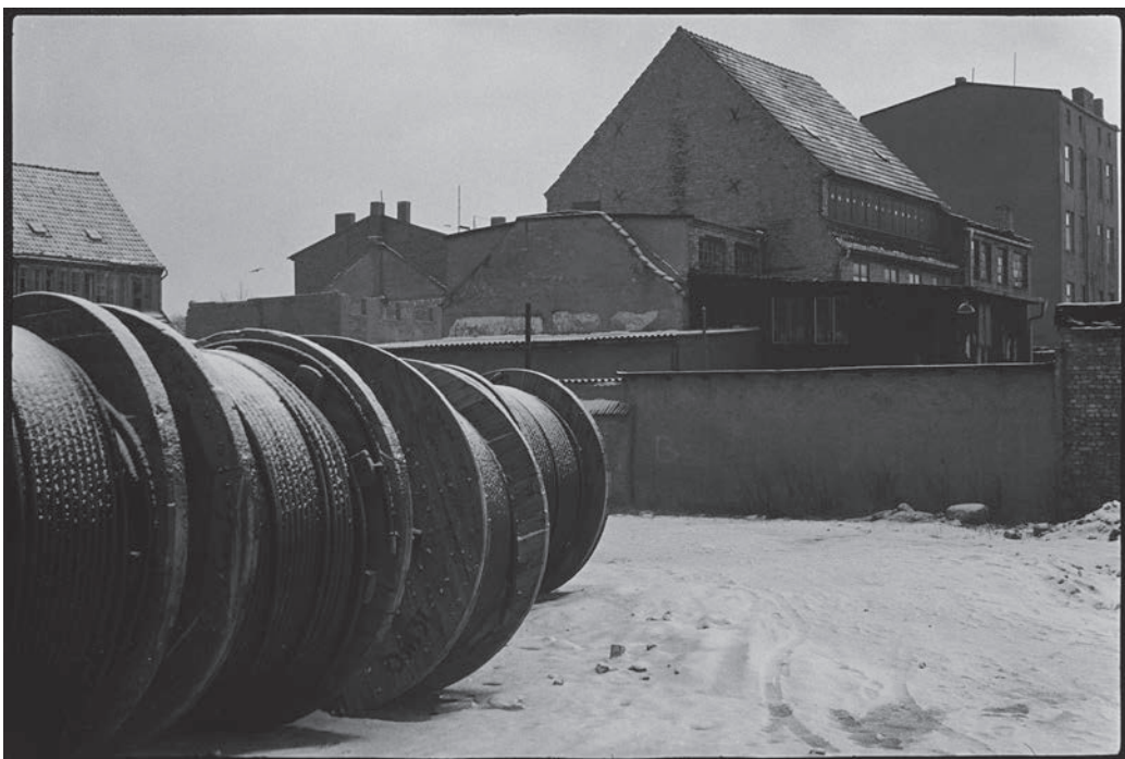
Rostock, Gerberbruch, 04.01.1986