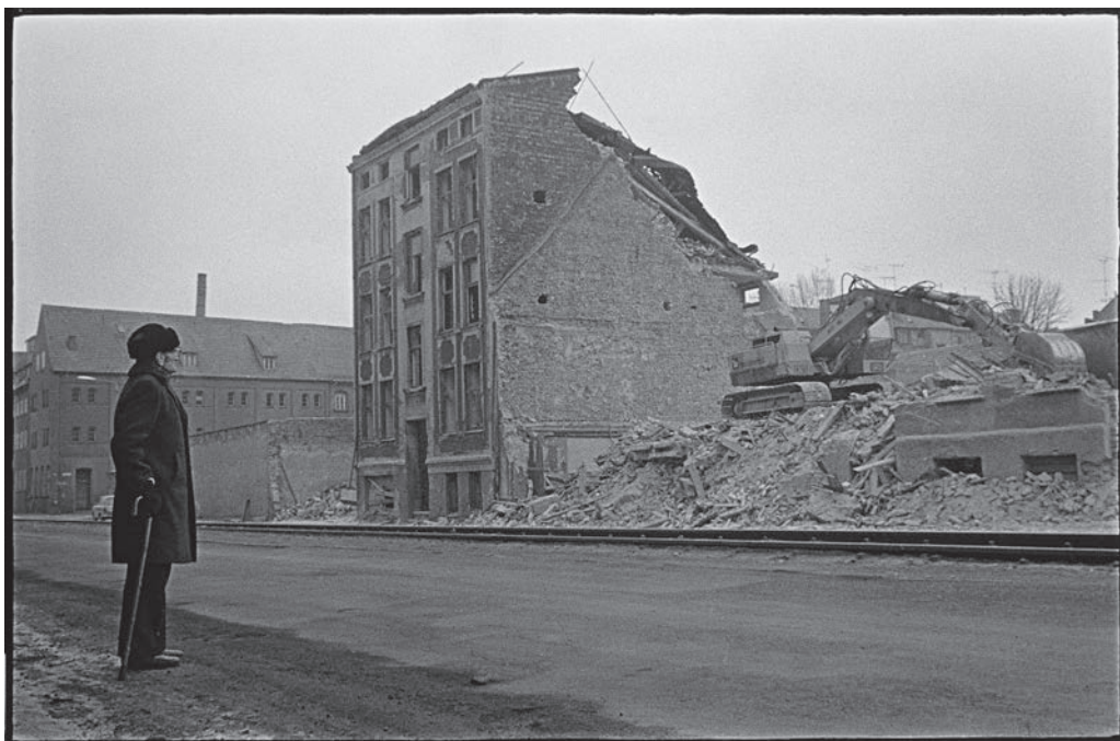
Rostock, Grubenstraße, 07.03.1987