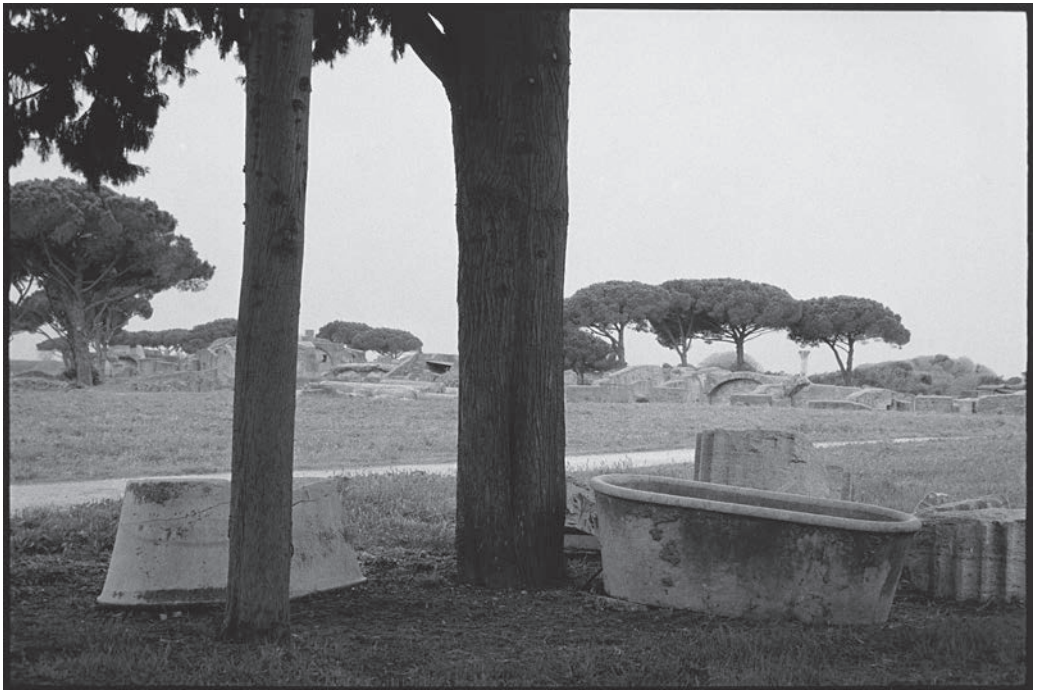
Rom, Ostia Antica, 15.04.2018