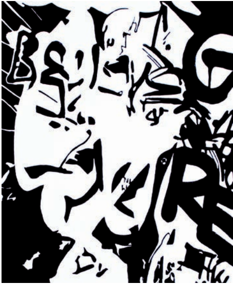
Wilko Hänsch A1, SW. Linolschnitt 2019, 50 x 40 cm

Im März 2018 wurden die traditionellen künstlerischen Drucktechniken des Hochdrucks, Tiefdrucks, Flachdrucks, Durchdrucks und deren Mischformen aufgrund eines gemeinsamen Antrages des BBK Berufsverbandes und des Museums für Druckkunst Leipzig in das Bundesweite Verzeichnis des Immateriellen Kulturerbes, das die Deutsche UNESCO Kommission seit 2013 führt, offiziell eingetragen. Der Kunstverein zu Rostock folgt auch in diesem Jahr dem Aufruf, sich an der Initiative „Tag der Druckkunst“ mit einer Veranstaltung zu beteiligen und so einen Beitrag zur Würdigung der Druckkunst zu leisten. Wir konzentrieren uns in diesem Jahr auf die Technik des Hochdruckes und seine verschiedenen Unter- und Sonderarten (Holz- und Linoldruck, Frottage, Montagedruck, Metallschnitt und Zinkographie).