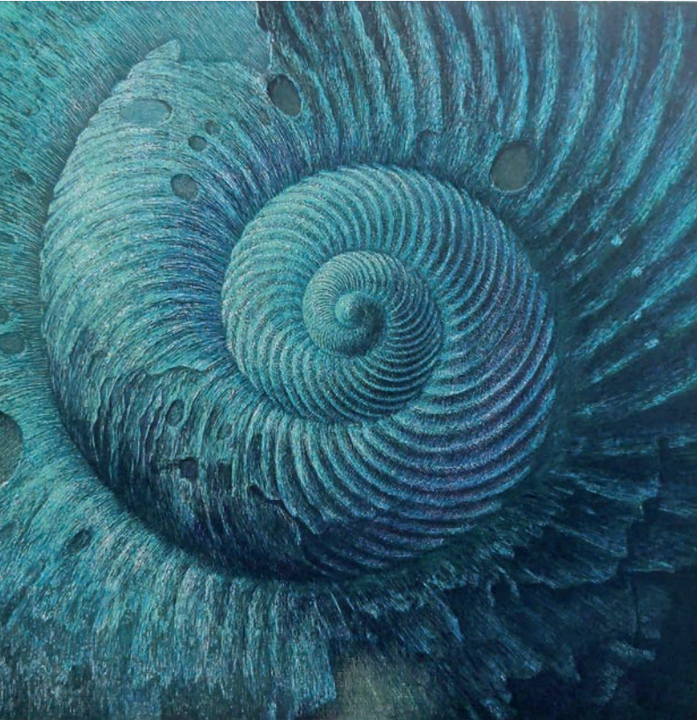
Abb.: Olaf Hoppe Atlantis-1 (Element Wasser). Farbholzschnitt von 8 Holzstöcken 2014, 37 x 37 cm

Titel: Hartmut Hornung Kopf nach C.T. Farbholzschnitt 2010, 60 x 42 cm