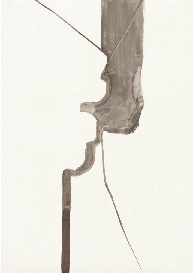
Katharina Neuweg aus der Serie Gefäße, 2019 Deckfarbe auf Steinpapier 70 cm x 50 cm