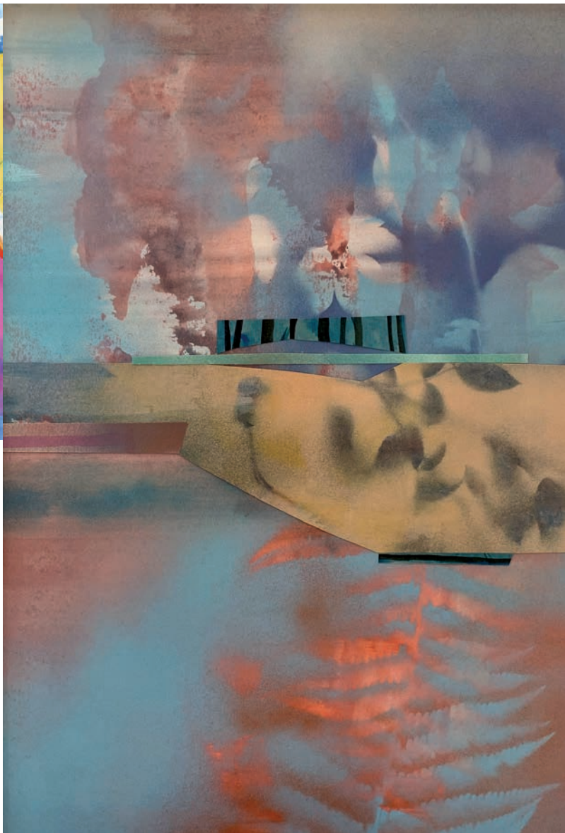
Abb. Titel.: Linda Perthen: Hochwasser. 2025, Grafische Collage 50 x 35 cm